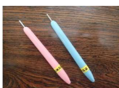
クイリングスロット