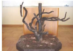
メインキャンドル台