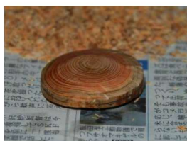
（下半分を削ったところ）