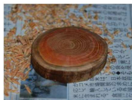
（上半分を削ったところ）