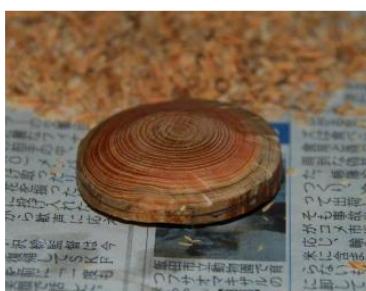
(下半分を削ったところ)