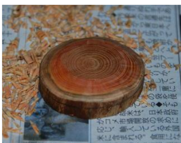
(上半分を削ったところ)