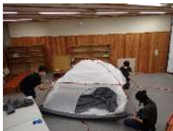
【スタッフトレーニング1日目】 テント張り、野外炊飯、講義