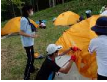
【1日目】 テント張り、仲間づくり、事業フラッグづくり